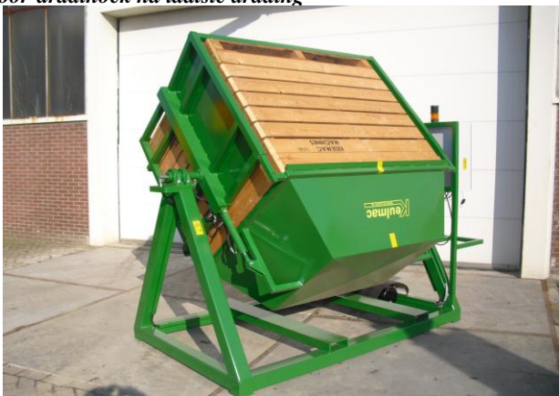
kistendraaier in bedrijf

met uitlopende zijkant voor inbreng van de kist electromotor met vertragingskast, rechtstreeks op de as hydraulisch bediend; op vier hoeken geleiding middels standaard meegeleverde afstandsbediening door PLC kast, volleding automatisch instelbaar van 1 - 99 keer traploos instelbaar