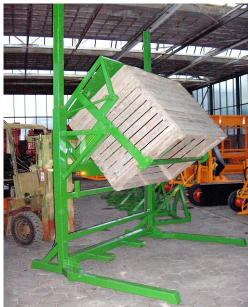
Keulmac mechanische kantelaar, type: 1500-130-410 ---->> met pootverbreding