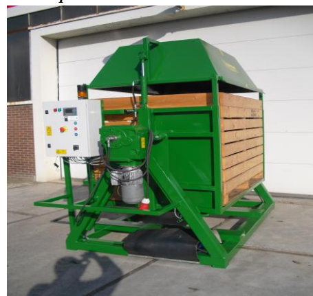
aandrijving en bedieningskast