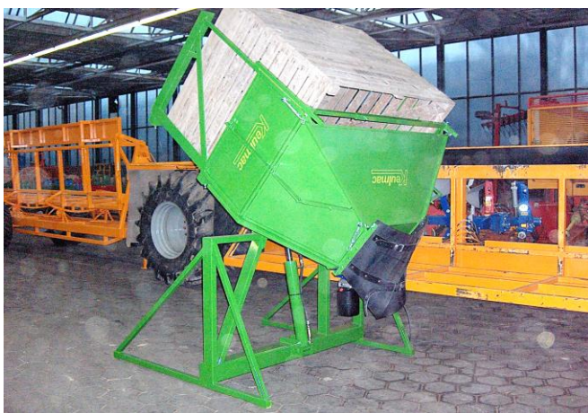
Keulmac hydraulische kantelaar met afdekplaat en uitloop